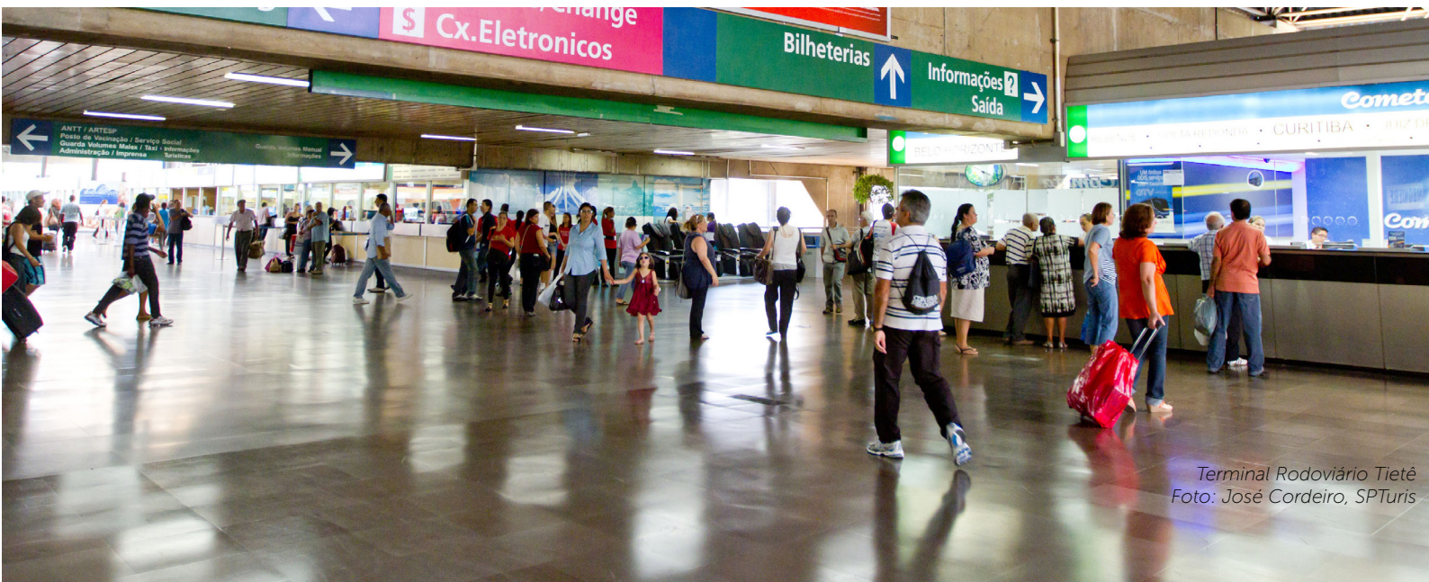
Terminal Rodoviário Tietê